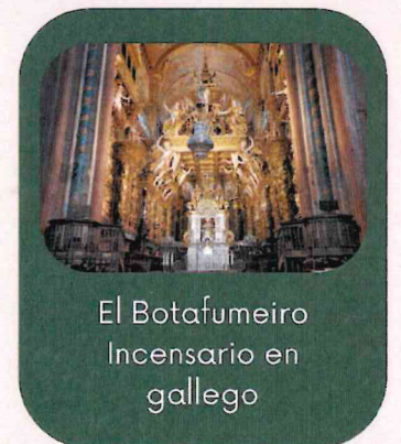
El Botafumeiro Incensario en gallego